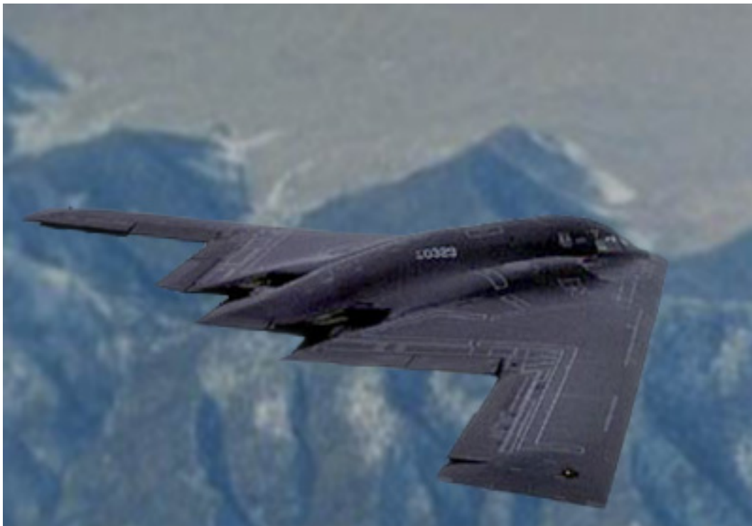
Gambar 3 Contoh bentuk pesawat stealth

Selain desain permukaan dan hidung pesawat, sayap pesawat juga dirancang berbeda. Jika pesawat biasa memiliki dua sayap yang menopang beratnya, pesawat stealth biasanya tampak seolah-olah hanya tersusun dari satu sayap saja, tanpa badan utama ( fuselage ) dan ekor pesawat ( tail ). Beratnya ditopang oleh keseluruhan pesawat. Rancangan semacam ini sangat membantu mengurangi drag atau hambatan udara yang bekerja melawan arah gerak pesawat. Berkurangnya hambatan udara berarti bahwa pesawat dapat bergerak lebih lincah di udara dan bisa memiliki kecepatan sangat tinggi.